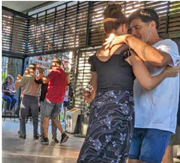
Clase y práctica de tango en el SUM de la plaza de Villa del Parque. Todos los viernes de enero a las 18:30 horas. Actividad a la gorra.

Entre la arboleda del parque, junto a las mesas y bancos de cemento donde algunos vecinos conversan, descansan, toman mate, hace un par de años la Comuna 11 construyó un salón abierto, muy agradable para reunirse en él cuando el buen clima acompaña. Durante el día funciona en el SUM "Julio Cortázar" una estación saludable, con una agenda de actividades destinada sobre todo a adultos mayores. Y ciertos días a la tardecita, el salón se convierte en bailable, con clases de fol-