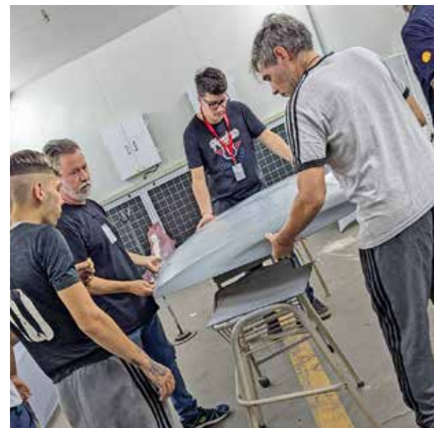
La cabina donde practican los estudiantes de “Pintor de carrocería” es igual a la que se usa en los talleres de chapa y pintura.

“Lo que tienen de bueno los trayectos es que se organizan en módulos que vas cursando y aprobando uno a uno. Vos podés hacer un módulo este cuatrimestre porque te da el horario, pero si el próximo no podés, no hay problema, lo retomás el año que viene. Cuando