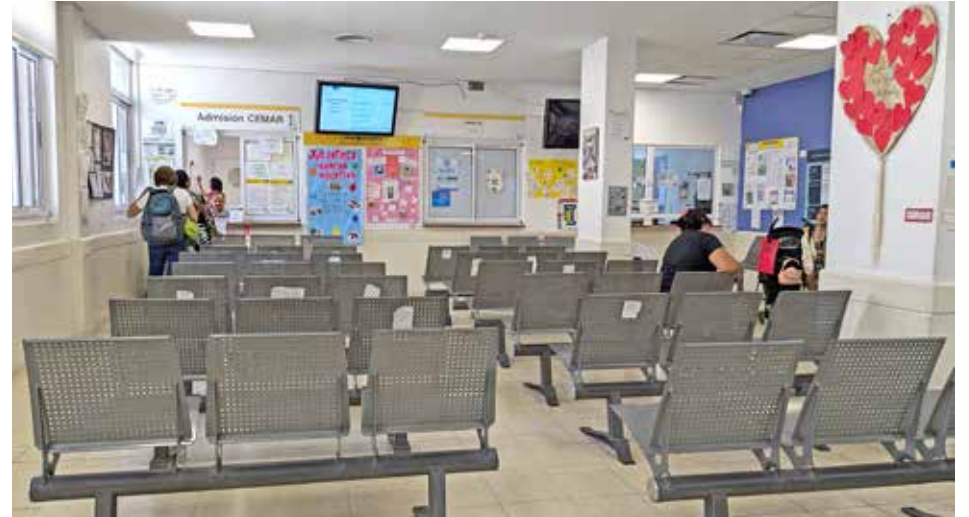
En Paternal comparten edificio el CeSAC 22 y el CEMAR 1, entre ambos cubren el primer y segundo nivel de atención. "Es un ejemplo fantástico de lo que debe ser un centro de salud, pero no da abasto."

Que la gente pueda atenderse en lugares cercanos a los que sea posible ir caminando, que haya más profesionales para responder a la demanda de salud mental, que exista una producción pública de medicamentos: son tres de las acciones que proponen los vecinos que participan del Consejo Consultivo Comunal 11 para mejorar la salud comunitaria.