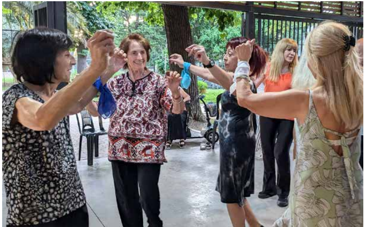
Clase de Folclore en la Plaza Aristóbulo del Valle.

Si sos chico, si sos grande, si te gusta bailar, escribir o dibujar, escuchar música en vivo o juntarte a ver películas, algo de todo eso vas a encontrar cerquita de tu casa. Pag. 2