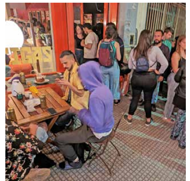
Café Artigas te invita a su "Veranito Acondicionado", con una agenda de música, cine, milonga, humor y mucho más.