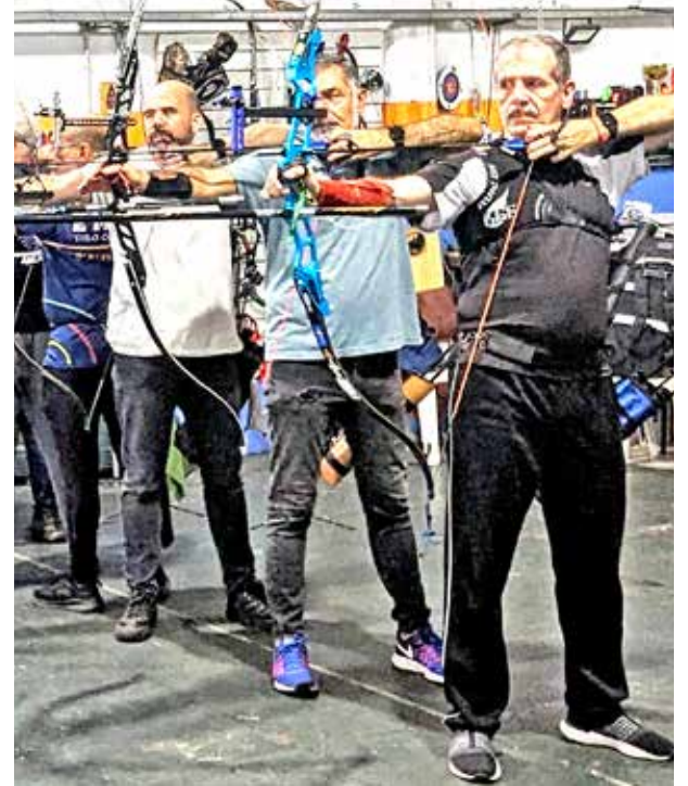
El Tiro con Arco tiene en Argentina 1900 arqueros federados. Uno de ellos participará de las Olimpiadas Paris 2024.

Separaremos los reciclables de la basura.