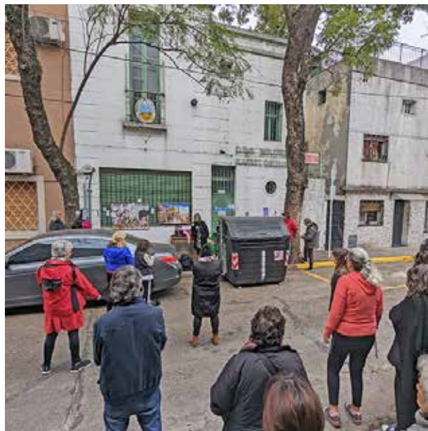
En 2023 se armó un colectivo vecinal para reclamar la reapertura de la Rafael Obligado. Con la biblio cerrada nuevamente, otra vez los vecinos se organizan.

En marzo las lluvias fuertes volvieron a anegar el edificio. Nuevamente se clausuró el primer piso y tampoco permiten usar la sala de lectura de planta baja. Solo mantienen activo el préstamo y devolución de libros, que circulan a un ritmo de 150 libros prestados por mes. Pero los días y horarios de apertura se modifican continuamente y eso, dicen las vecinas, dificulta el vínculo con la biblioteca. Ante esta situación, el colectivo vecinal reclama otra vez la reparación del edificio y la reapertura total. Que vuelvan las actividades culturales abiertas al barrio, que vuelva la biblio Rafael Obligado a ser un espacio de encuentro con la lectura, disponible para estudiantes y vecinos en general. Para visibilizar y dar fuerza a su pedido están organizando una merienda y maratón de lecturas en la vereda de la biblioteca el sábado 18 de mayo. Apenas esté definido el horario y el detalle de la actividad será publicado en el Instagram @barrionazca.