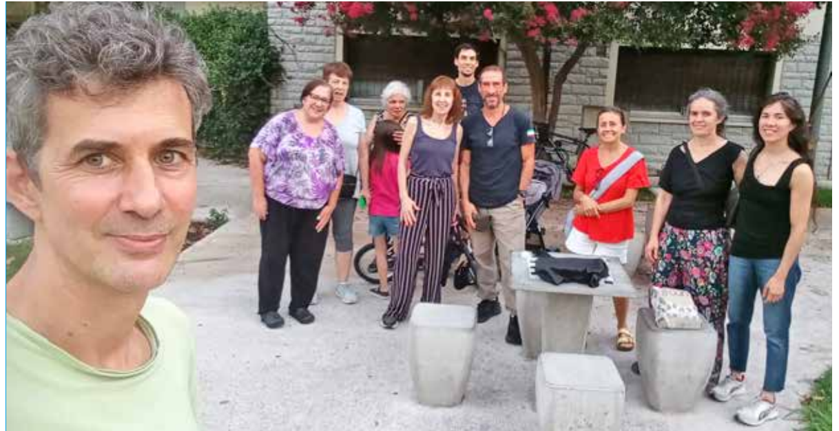
Una selfie de la primera reunión del 2025 de los vecinos y vecinas que participan en "Una plaza para Villa Santa Rita".

Por Guillermina Bruschi y Mariana Lifschitz