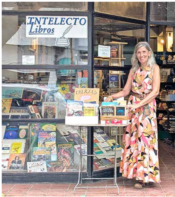
Alicia en el país de los libros

voy a publicar. Y por ahí cuando tomo un libro pienso en personas concretas, como que ya mi mente dice por ahí fulano ve este y le gusta y a veces pasa que sí.”