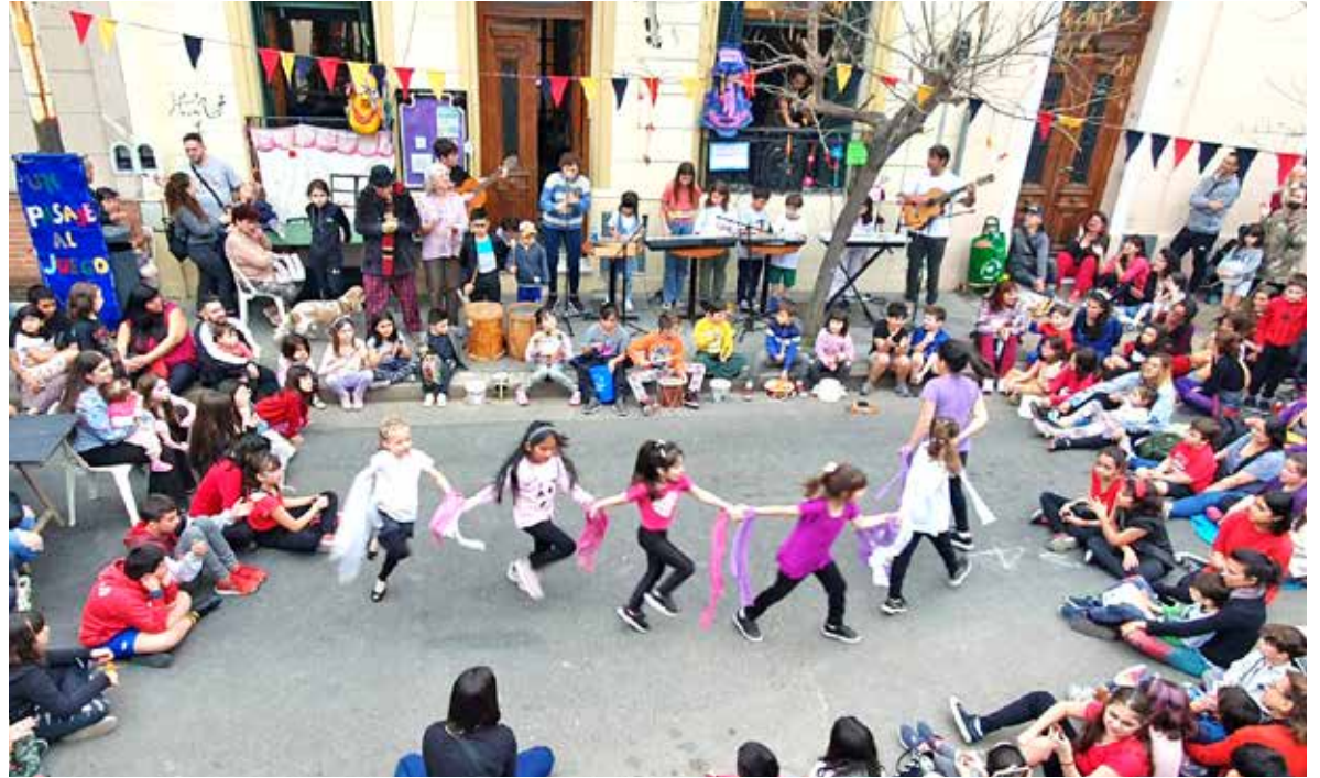
Festival infantil "Despedida del Invierno" en el pasaje La Selva, frente al centro cultural.