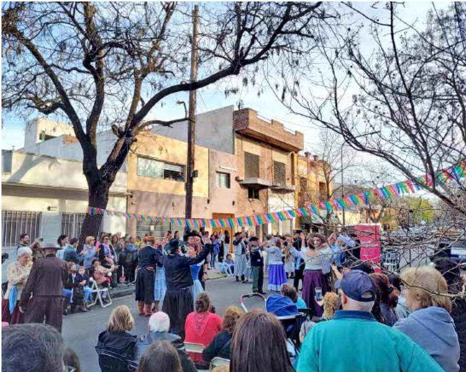
Momento de danzas folclóricas sobre el asfalto de Camarones y Lavallol en la cuarta edición del Festival Santarritense (2023), con la compañía de bailarines de la Corporación Mitre.

oportunidad para festejar también otros hechos del barrio, que tienen su historia”, Mariela se refiere al ciclo “Música en el Camarín” de la iglesia Santa Rita, que cumple 10 años; a la biblioteca pública Rafael Obligado, que cumple 84; y al reclamo para que Villa Santa Rita tenga una plaza, que cumple 44. Este último, por suerte, muy pronto dejará de cumplir años, en cuanto se inaugure la plaza de Jonte y Granville: ¡un gran motivo de festejo!