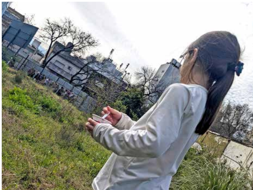
El baldío de Jonte y el Pasaje Granville pronto será la primera plaza del barrio.

Una visita al baldío de Jonte 3222, donde se construirá la primera plaza del barrio, dio pie al grupo vecinal "Una Plaza para Villa Santa Rita" para exponer ante los funcionarios presentes la necesidad de más espacios verdes. Recordaron que quedan pocos lotes ociosos y que urge transformarlos en plazas antes que sean utilizados para desarrollos inmobiliarios. Pag. 2