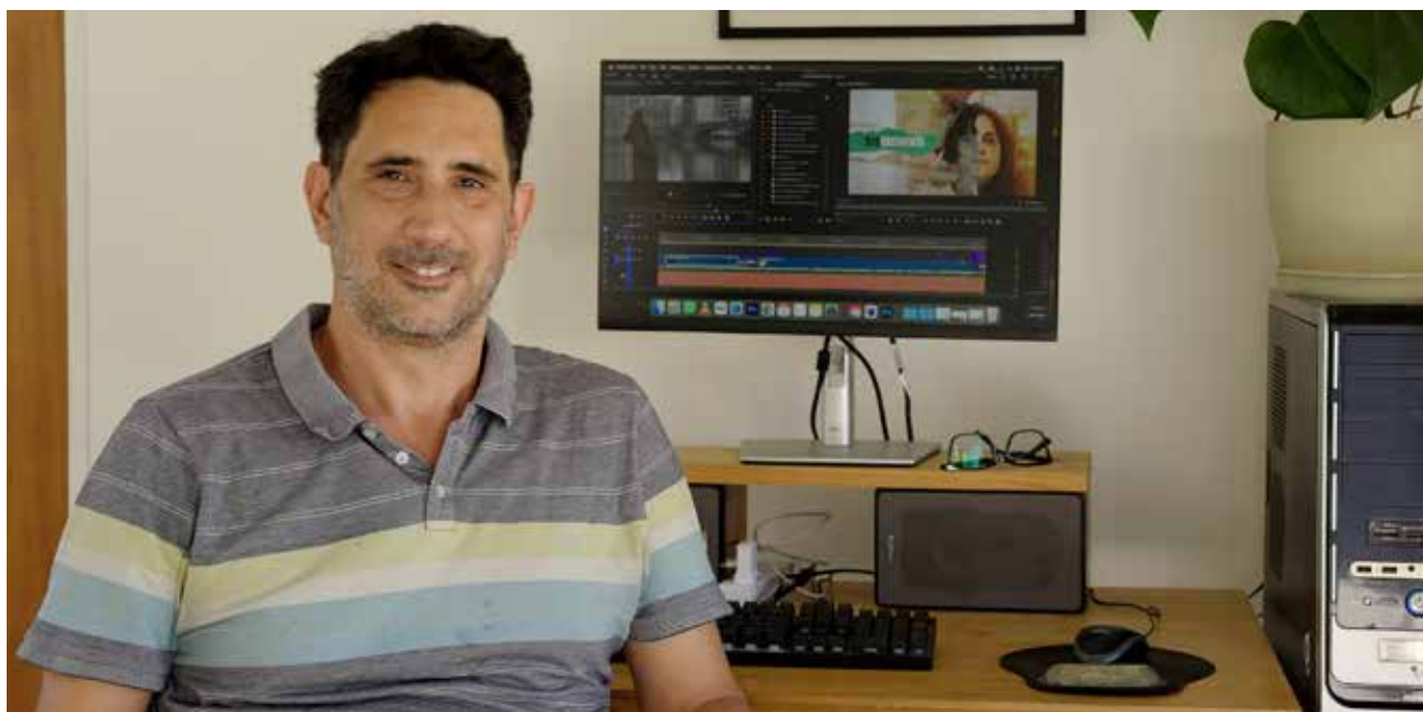
"Desobediente", de Federico Coringrato, tendrá su estreno próximamente. Toda la info será publicada en el Ig. @desobediente_documental

Octubre 23, su primer documental, se llama así porque esa fue la fecha, en 1976, del secuestro de los estudiantes. La película entrevista a varios de sus compañeros y a algunos familiares. A través de un relato coral reconstruye quiénes fueron estos chicos y chicas, cómo vivían, qué les gustaba, de qué se trataba su militancia adolescente, cómo sucedió su secuestro y desaparición.