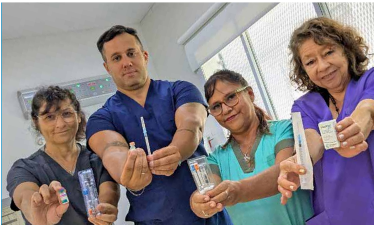
En el vacunatorio del Cesac 23 su equipo de enfermería atiende de de 8:30 a 12:30 y de 1:30 a 17:30 horas. Para recibir las vacunas de calendario no se requiere orden médica ni sacar turno.

Además: información sobre su consultorio de adolescencias y de salud sexual integral más una oferta de múltiples actividades comunitarias. Pag. 2