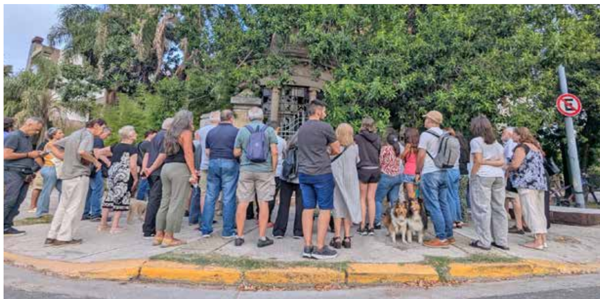
Jueves 5 de marzo de 2026. Convocatoria vecinal para defender el patrimonio edilicio y cultural de la Casa de Francisco Beiró.

Tras dos incendios en los últimos 13 meses, vecinos y organizaciones se reunieron frente a la Casa Beiró para exigir su preservación. Crónica de una asamblea barrial que reconstruye la historia del abandono y reactiva el reclamo por este ícono de Devoto. Por Verónica Ocvirk