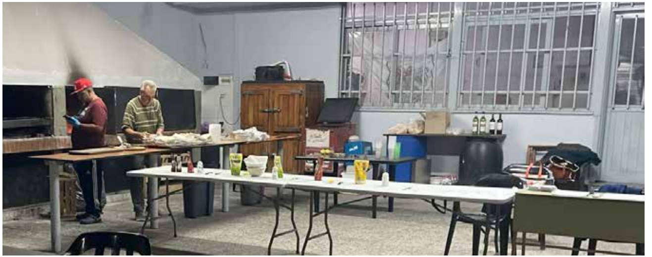
Sandwiches de hamburguesas y vacío a la parrilla, preparando el menú de los viernes con torneo de truco.