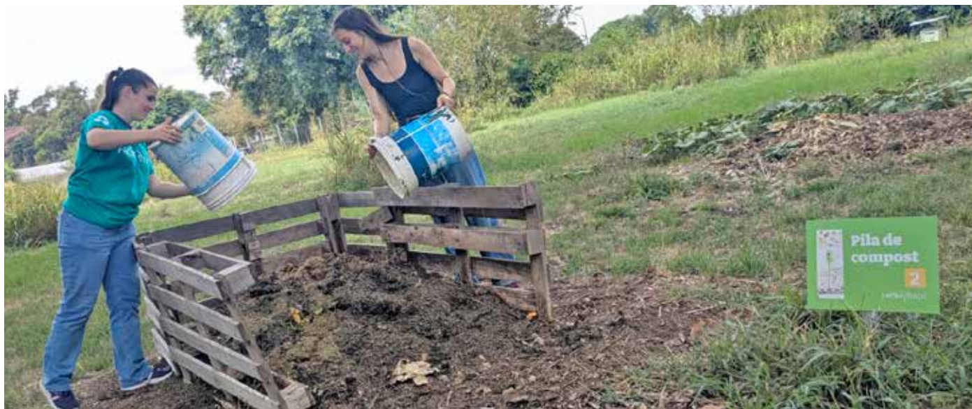
En el compostario de la Agronomía vuelcan los restos de orgánicos que se consumen en la Facultad. El compost generado lo utilizan para abonar la tierra en sus canteros de plantas nativas.