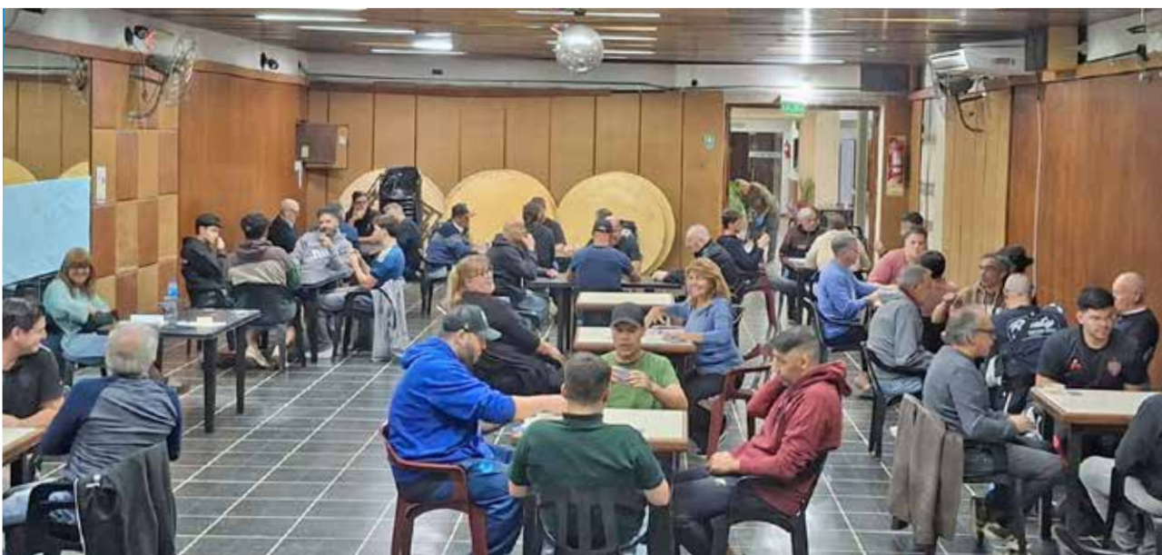
El salón a pleno durante el torneo de truco.