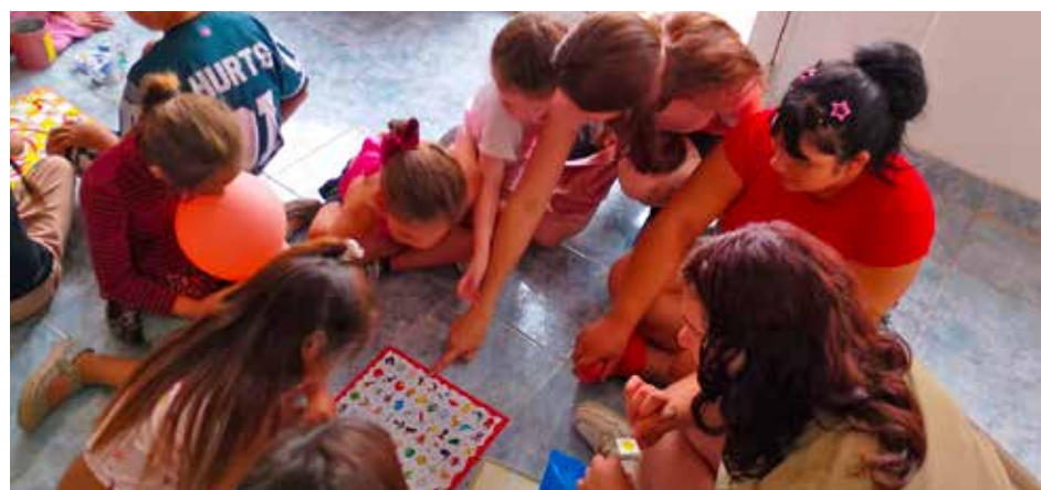
Jóvenes y peques compartiendo el juego en la Casa de la Niñez.