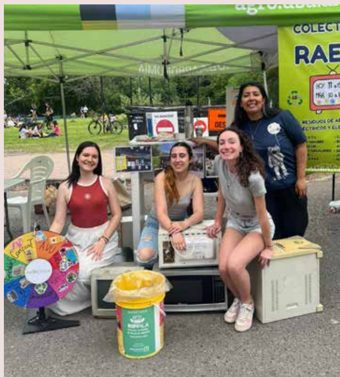
Colecta de reciclables RAEE y encuentro con la Cooperativa "Reciclando Trabajo y Dignidad" en la Facultad de Agronomía.

Próxima colecta: Jueves 30 de abril de 10 a 18 horas, en el pabellón central de la Facultad de Agronomía, stand de FAUBA Verde.