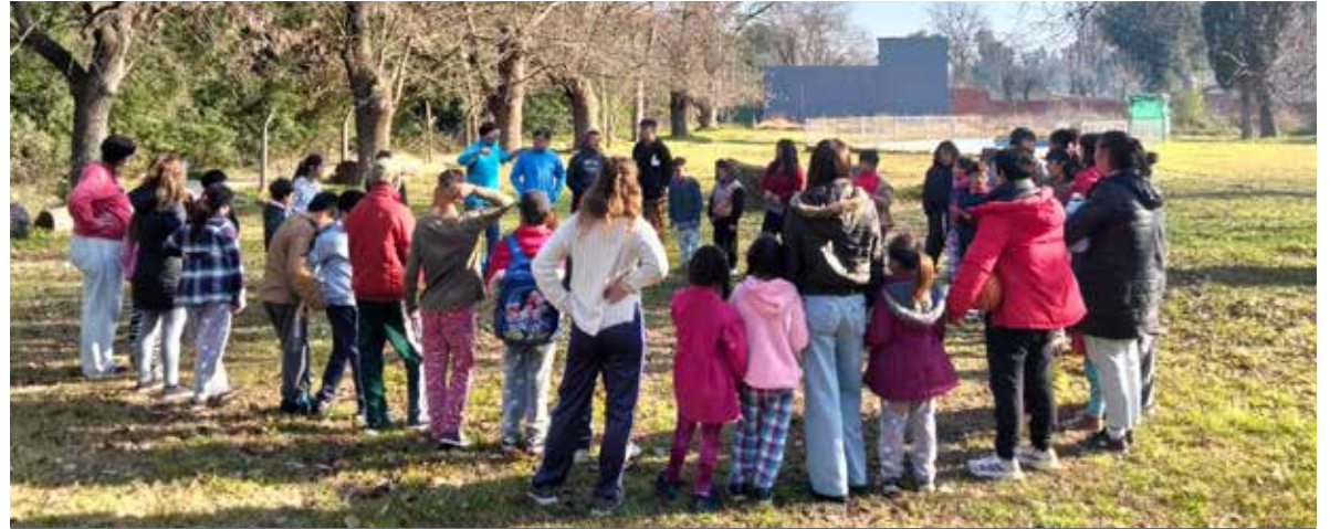
Ronda con que se da inicio a las actividades cada sábado.